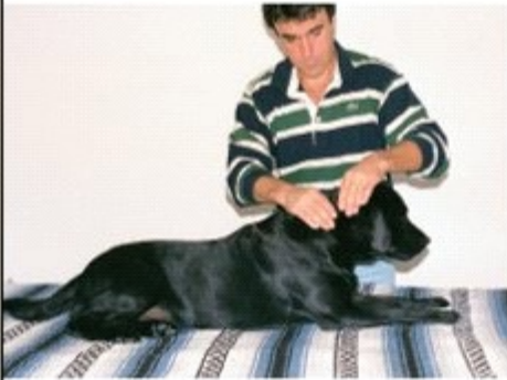
Kahden käden pusertelu

rentouttava vaikutus hermostoon. Otetta käytetäänkin tästä syystä rentouttavassa hierontamenetelmässä niskan alueen hoitamiseen. Kun ote tehdään kahdenkäden puserruksena ja nopeammassa tempossa, saadaan aikaiseksi erittäin stimuloiva vaikutus niin aineenvaihduntaan kuin hermostoonkin. Reipas rytmi virkistää koiraa. Pusertelu on hyvin käyttökelpoinen ote raajojen lihasten lämmittämisessä kylmällä ilmalla, esimerkiksi triceps, fleksorit ja ekstensorit.